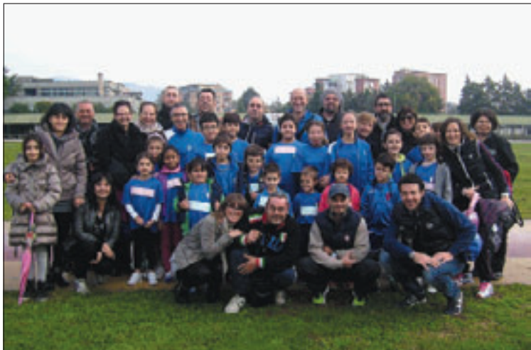
I RAGAZZI DEL GSI SEZIONE ATLETICA DOPO LE GARE DEL TROFEO D'AUTUNNO AL CONI